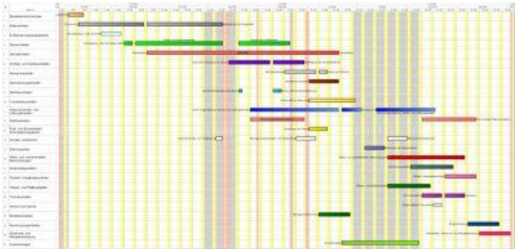
((Abb. 2, SchwarzboldLentz_Bauzeitenplan.jpg)): Bauzeiten- und Bauablaufpläne sind nicht nur ein Planungshilfsmittel – sie sind auch eine wertvolle Orientierungshilfe für Handwerker und Bauherren