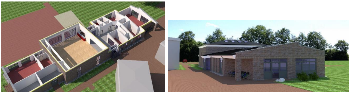
((Abb. 3, SchwarzboldLentz_Gesamtgebäude.jpg oder SchwarzboldLentz_Kunstraum.jpg)): CAD- und AVA-Software für die Planung, Visualisierung und Ausschreibung gehören ebenso zur Büroausstattung ...